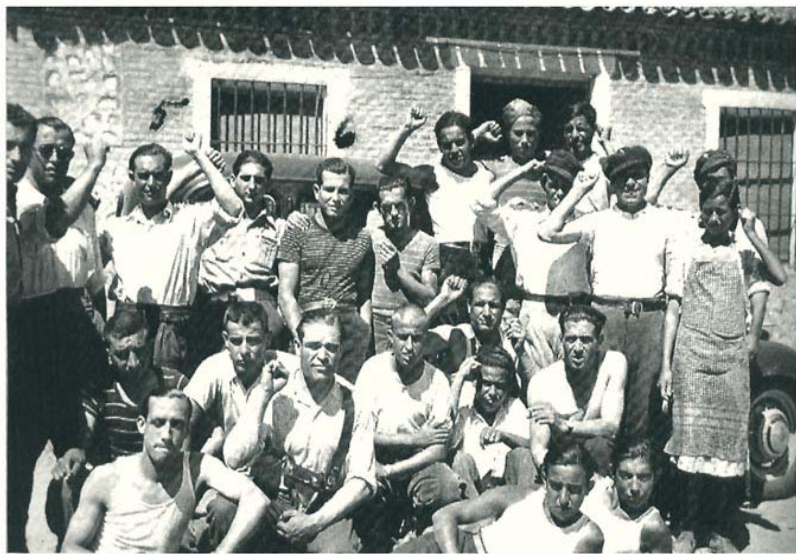
Los niños de la noche (Andalucía)

Los guerrilleros también encontrarán colaboración en las minas y entre los pobladores y trabajadores del monte. Esta sociedad aislada, vive con fuertes contradicciones, con un equilibrio exageradamente decantado a los vencedores y con fuertes restricciones para la libertad de los perdedores. Los rumores que las sombras de la noche eran guerrilleros, se convirtió en una realidad y, su existencia, equilibra de nuevo la balanza, pobremente, pero en tiempos de tragedia, un rayito de luz puede desenvolver la mayor de las esperanzas.