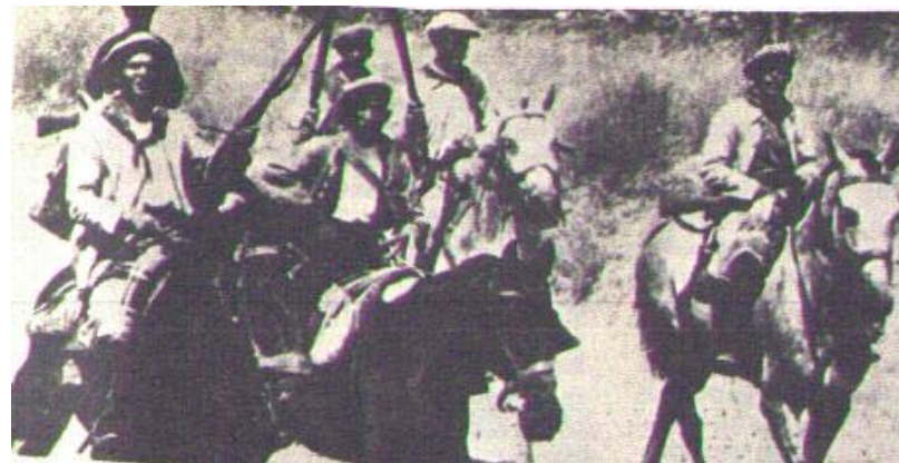
Campeños andaluces armados, que constituyeron en los primeros días de la guerra civil el llamado “frente de las sierras”, embrión de las futuras guerrillas en la zona meridional.