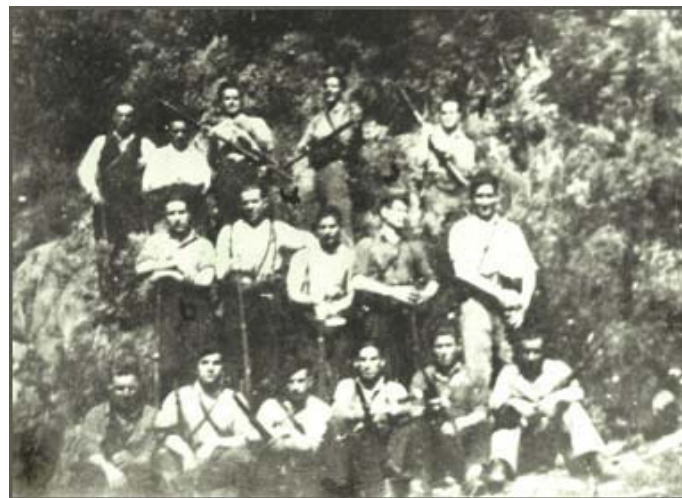
Peñas de Ferradillo, 1942

Día de la fundación de la primera organización guerrillera "Federación de Guerrillas de León y Galicia", en abril de 1942. 24 guerrilleros se habían reunido en las peñas de Ferradillo (T.M. de Priaranza del Bierzo).