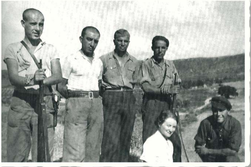
Los niños de la noche (Andalucía)