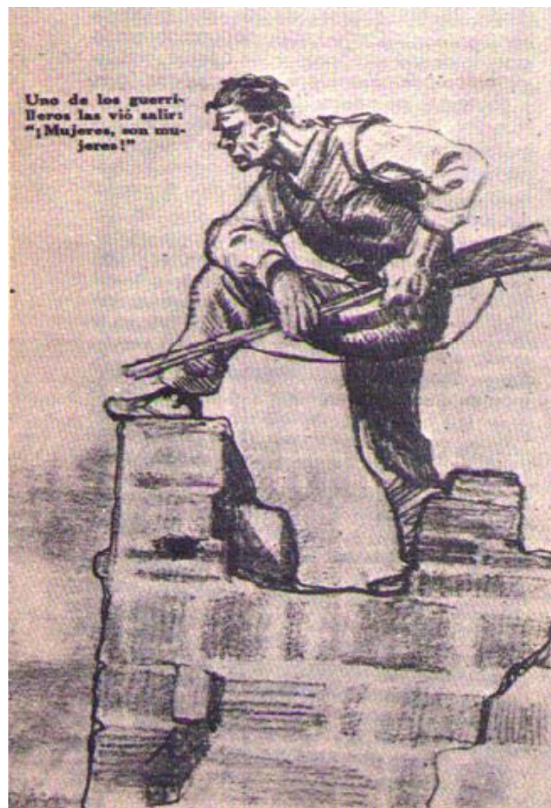
Dibujo de Lázaro sobre guerrilleros, publicado en "Estampa" en 1937 (Extremadura)

CUADERNOS DEL CAUM LA GUERRILLA ANTIFRANQUISTA