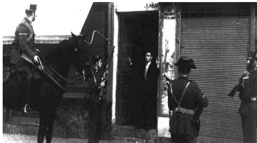
Detención de un guerrillero

Dos años después de esta evasión, las autoridades franquistas disolvieron los pocos destacamentos que había en Los Montes de Toledo por “haber desaparecido las causas que motivaron su creación”. Era la clara constatación del fracaso de la guerrilla antifranquista en el centro de España, algo que ya se había puesto de manifiesto de una manera evidente diez años atrás.