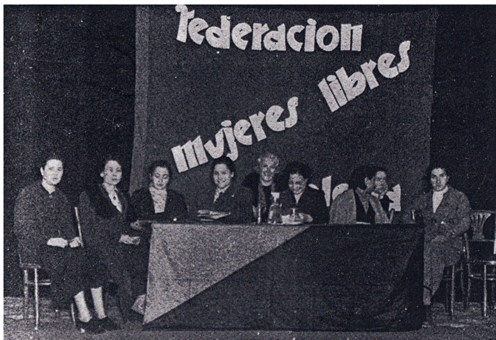
Acto de la Federación de Mujeres Libres.