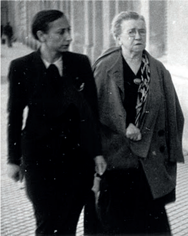
Lucía Sánchez Saornil & Emma Goldman