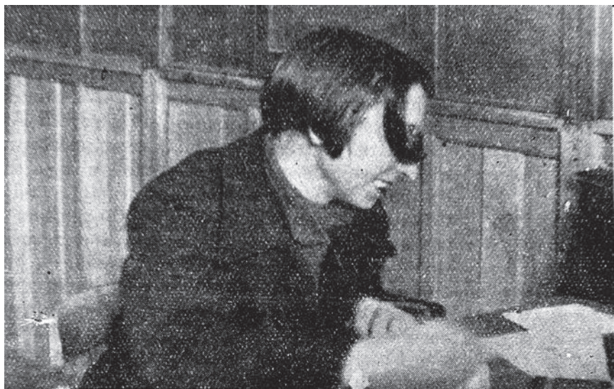
Lucía Sánchez Saornil, de la Redacción de "C. N. T."