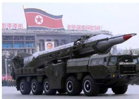
Misil Taepodong-2 norcoreano

No deja de llamar la atención cómo un país de dimensiones reducidas, con 24,5 millones de habitantes y una economía que ha sufrido crisis gravísimas, con serios problemas para alimentar a su propia población, puede haberse empeñado en desarrollar un programa de armamento nuclear y en disponer de vectores de lanzamiento susceptibles de cargar con ojivas atómicas y ser capaces de enviarlas a miles de kilómetros de distancia. Y todo es porque el régimen de Pyongyang decidió que el hecho nuclear fuera el elemento central de su estrategia. Aunque los medios de comunicación suelen prestar mucha más atención al desarrollo nuclear, la proliferación de misiles balísticos ha sido una preocupación clave en Corea del Norte. Actualmente, solo hay cinco países que poseen misiles balísticos intercontinentales de alcance superior a 5.500 kilómetros, además de armas nucleares y los cinco son, casualmente, los que cuentan con un asiento permanente en el Consejo de Seguridad de Naciones Unidas. En el escalón directamente inferior hay seis países con medios capaces de ir más allá de los 1.000 kilómetros: Arabia Saudí, Corea del Norte, India, Irán, Israel y Pakistán.