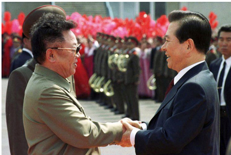
Cumbre Kim Jong-il y Kim Dae-Jung en Pyongyang, junio de 2000

oleoducto que uniría las dos Coreas. Así mismo, autorizó que a partir de noviembre los surcoreanos pudieran visitar la zona turística del monte Kumgang.