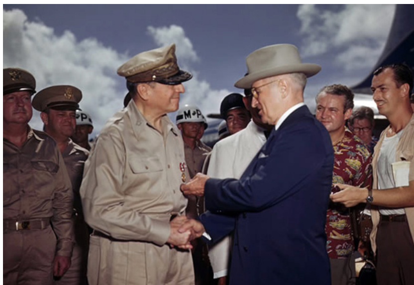
Entrevista Truman–MacArthur en la isla de Wake, 12 de octubre de 1950

contingentes multinacionales a su Ejército. Las intenciones de MacArthur eran dejar dos divisiones en Corea hasta que se materializase la reunificación, poner dos a disposición del general Bradley para desplazarlas a Europa y trasladarse con el resto de las fuerzas a Japón. Ante las dudas del presidente sobre la posibilidad de la intervención china en la guerra, algo a tener en cuenta si las fuerzas de Naciones Unidas se aproximaran a Manchuria y considerando las concentraciones de tropas allí, MacArthur mostró su confianza en la no intervención, dada la superioridad aérea con la que contaba. Igualmente descartaba la entrada de la Unión Soviética, teniendo en cuenta las dificultades de transportar fuerzas de importancia al teatro coreano a través de Siberia.