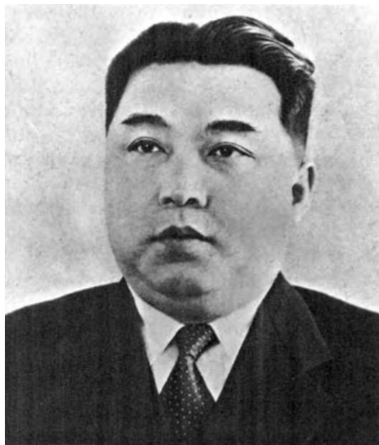
Kim Il Sung

clamó, el 9 de septiembre la República Popular de Corea, reconocida en octubre por la URSS como único gobierno legítimo de Corea. Kim Il-sung había sido patrocinado desde hacía tiempo por los soviéticos. Llegó durante la Segunda Guerra Mundial, con el apoyo de Stalin y con el ejército Rojo 19 . Desde el principio tuvo como modelo el sistema soviético. Era muy nacionalista y, por lo tanto, muy contrario a la colonización japonesa. También estuvo mucho tiempo vinculado al partido comunista chino. Fue consciente de que la expulsión de los japoneses de Corea requería la ayuda exterior. En ese contexto consideraba que el apoyo soviético era, en los cuarenta, un respaldo mayor que el de China, que había desempeñado en la historia de Corea un papel hegemónico mayor. Carente de carisma, a diferencia de otros líderes comunistas como Tito o Mao Zedong, sería muy fiel a la doctrina estalinista, lo que