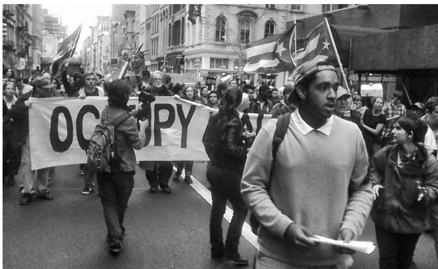
“¡Toma las calles!” Camino de Parque Zucotti -15 de noviembre-.

El movimiento OWS ha invertido la tendencia a la inhibición en la lucha, ha roto con la pasividad de antaño y ha imitado a los trabajadores y a los estudiantes de El Cairo y Wisconsin cuando dijeron: “¡Basta! Hasta aquí hemos llegado.”